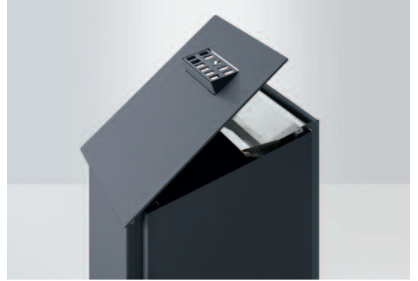
Akzeptanz schafft Sauberkeit: Keckk wird durch einen großen Einwurf und den zentralen Ascher gut angenommen.