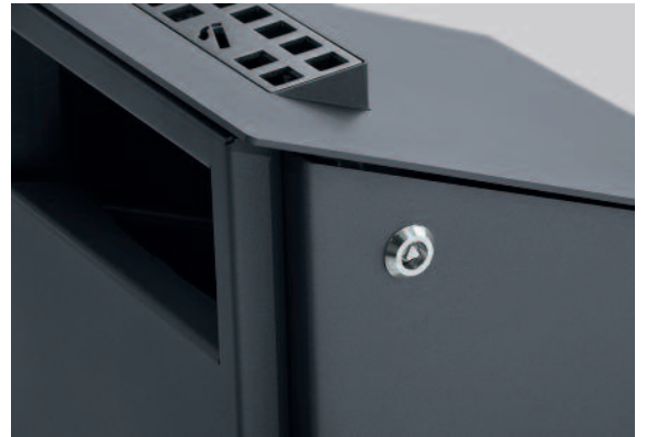
Keckk bietet optional einen Ascher mit Maxivolumen, der sich automatisch beim Öffnen des Deckels entleert wird.