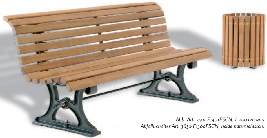
Abb. Art. 2501-F1401FSCN, L 200 cm und Abfallbehälter Art. 3630-F1300FSCN, beide naturbelassen.