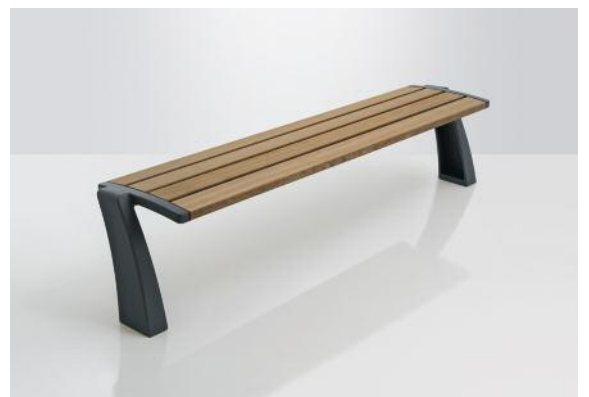
Harmonie als Hockerbank.