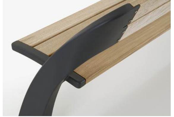
Der schwungvolle Formverlauf – kombiniert mit dem Wissen um die "richtigen" Winkel und Maße – schafft hohen Sitzkomfort.

und betont so die Leichtigkeit der Bank.