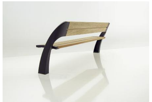
Harmonie hat keine typische Rückseite. Auch von hinten macht diese Bank eine gute Figur.