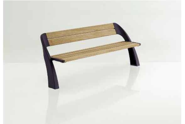
Die zeitlose Form, der rostfreie Aluguss und die hochwertigen Hartholzleisten sorgen für besondere Dauerhaftigkeit.