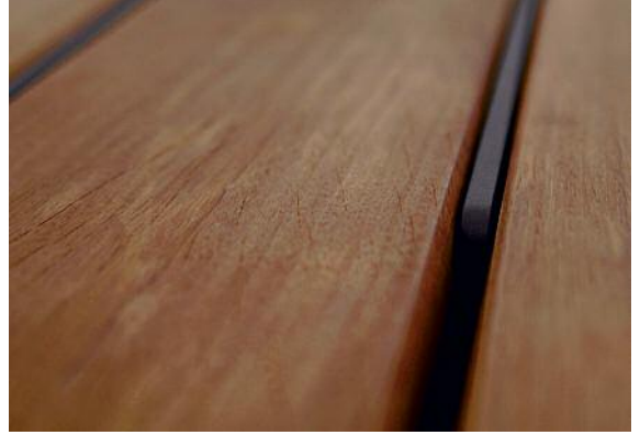
Die massiven Holzbohlen werden von ebenso massiven Stahlrippen präzise auf Distanz gehalten.

Insgesamt lässt sich das System endlos ketten.