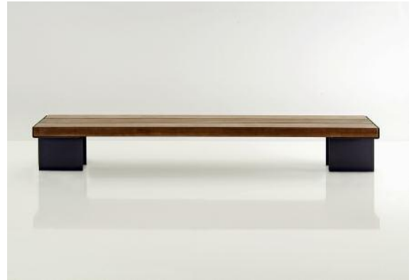
Mit 3 Metern Spannweite in der kleinsten Ausführung ist Kaje ein Großbanksystem.