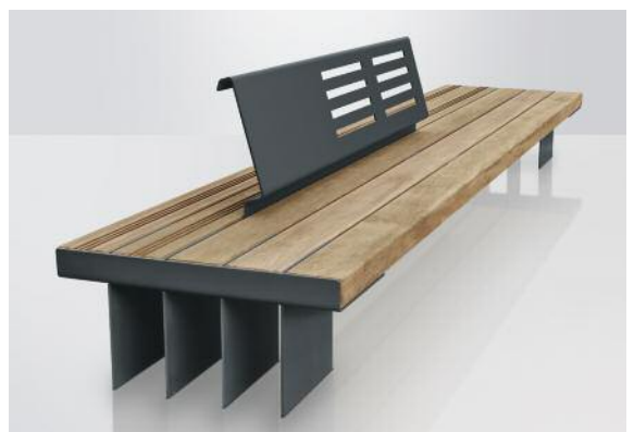
Optional mit Rückenlehne aus 8 mm dickem Stahl erhältlich. Positionierung variabel.