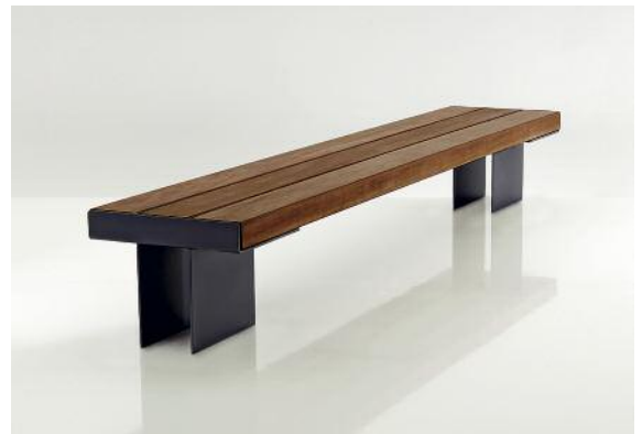
Die Stahlfüße sind standardmäßig DB 703 Eisenglimmer Anthrazit lackiert.