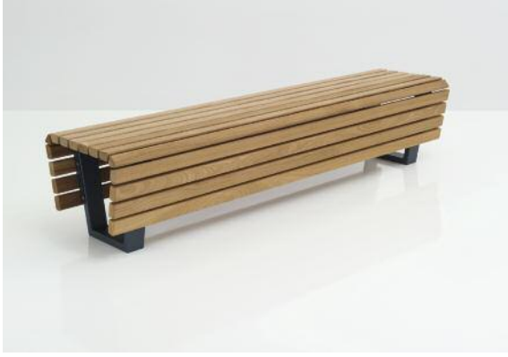
Hockerbank Scala mit FSC-zertifizierten Hartholzleisten und Stahlfüßen, feuerverzinkt und DB 703 Eisenglimmer Anthrazit lackiert.