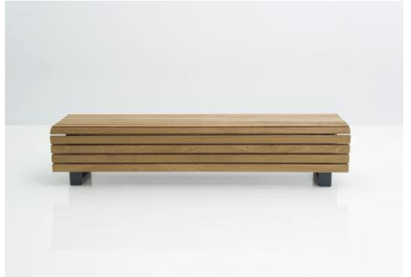
Auch die Hockerbank Scala (Art. 2303-F1400FSCN) bietet durch die tief ansetzenden Leisten einen geschlossenen Körper.