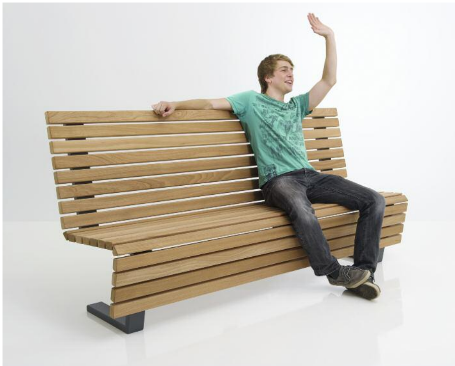
Die bequeme Bank Scala bietet sehr angenehmen Sitzkomfort durch die besonders hohe Rückenlehne.