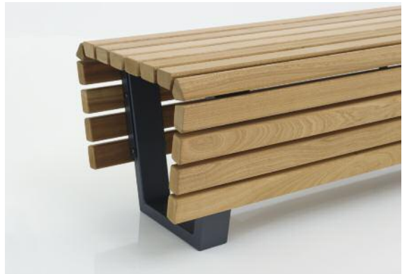
Hockerbank Scala mit Stahlfuß aus 80/30er Rechteckrohr mit verdeckter Verschraubung der Holzleisten.