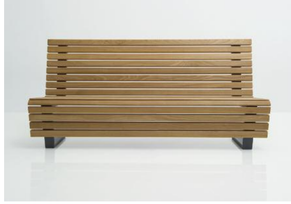
Bank Scala mit insgesamt 20 Sitz-, Rücken- und Frontleisten aus FSC-zertifiziertem Hartholz.