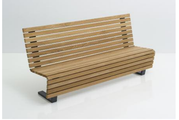
Scala mit angenehm hoher Rückenlehne und sitzbequem nach hinten geneigter Sitzfläche (Art. 2303-F1401FSCN).