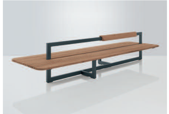
Wahlweise mit einem oder zwei Rückenlehnkissen.