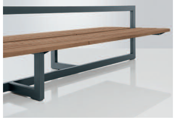
Doppelbank Lenza ohne Rückenlehnkissen.

Eine Bank – viele Funktionen: Sitzen und auf den Bus warten. Treffen zum Chillen und kommunizieren. Ausruhen an komfortablem „Rückenlehnpolster“ aus Holz. Die 380 cm lange und 113 cm breite Doppelbank Lenza ist eine Erlebnisoase neuer Art.